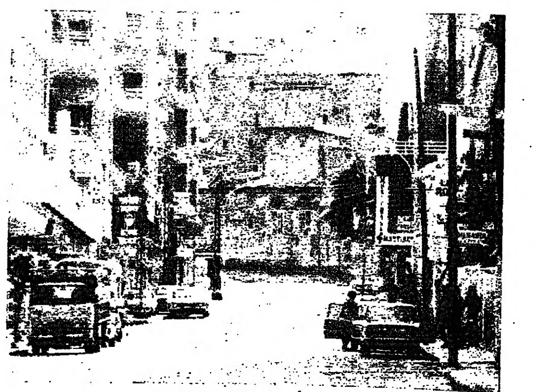
شارع بيتي خاليا نسي المنطقة التجارية